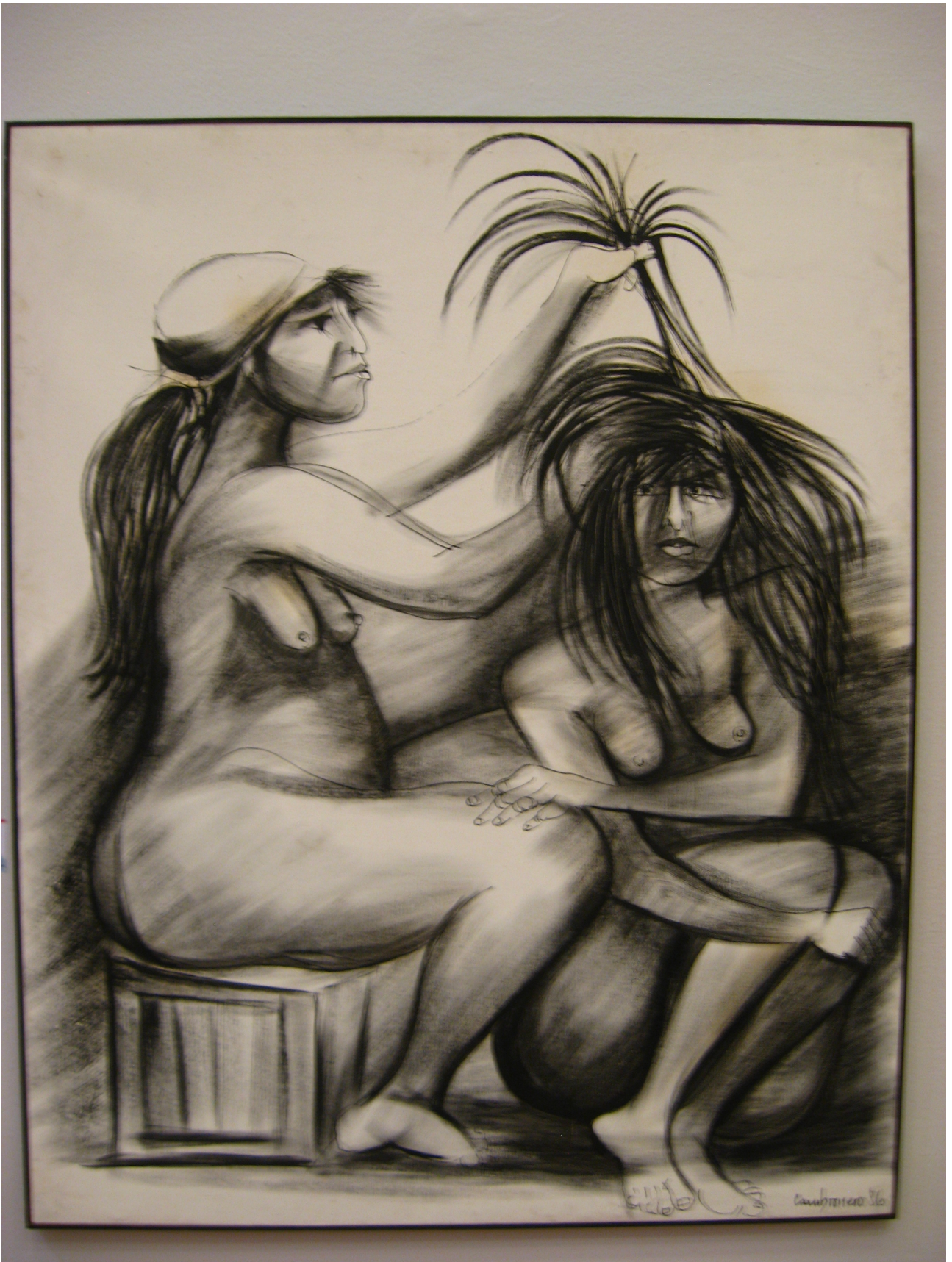
“Peinando en domingo”