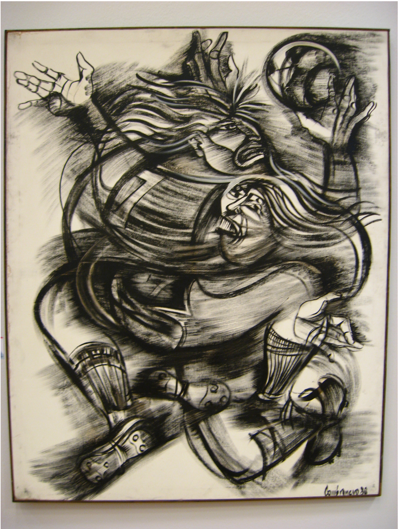
“Tarjeta roja” pintura acrílica sobre tela.